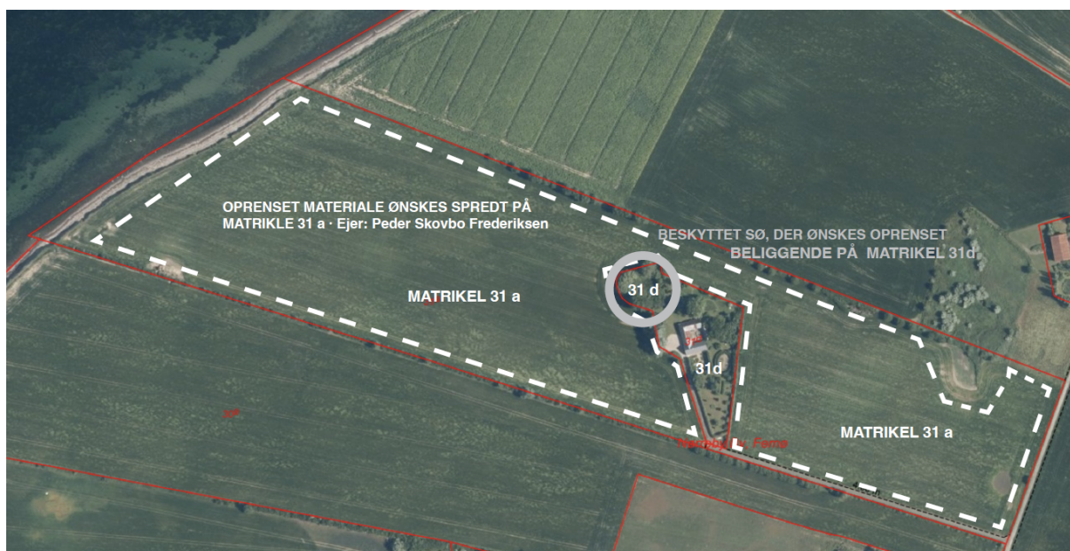
Figur 1. Kort fra ansøgningsmaterialet. Søen som ønskes oprenset, ses markeret med en grå cirkel. Det oprensede materiale fra søen ønskes spredt ud på marken på nabomatriklen, som er markeret med hvidt stiptet omrids.

Lolland Kommune har gennemgået luftfoto af søen, for at vurdere om der kan gives dispensation til at oprense søen. På luftfoto fra 1993 og frem til i dag, ser søen ud til at være tilgroet med træer hele vejen rundt om søen og med et tæt dække af tagrør i vandfladen af søen.